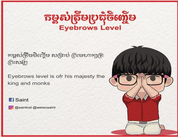
Hình 5. Chấp tay ngang lông mày