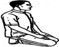
សិលាបថទី១