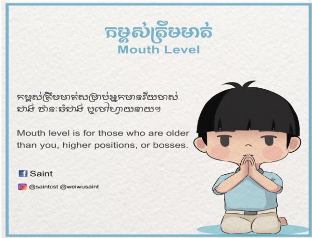
Hình 3. Chấp tay ngang miệng