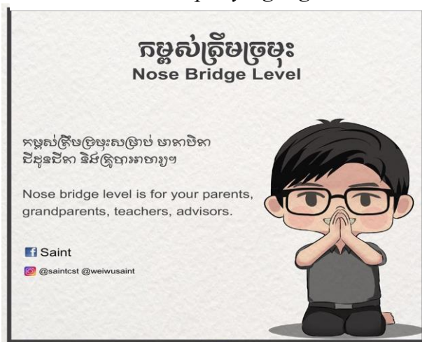
Hình 4. Chấp tay ngang mũi