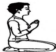
សិលាបថទី២