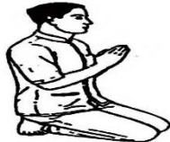
សិលាបថទី២