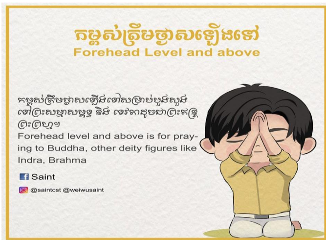
Hình 6. Chấp tay ngang và phía trên trán