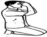
សិលាបថទី៣