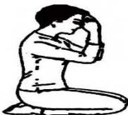
សិលាបថទី៣