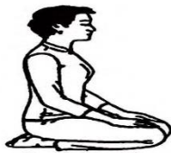
សិលាបថទី១